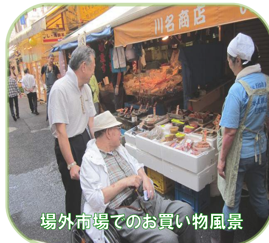
場外市場でのお買い物風景