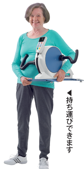
▲持ち運びできます