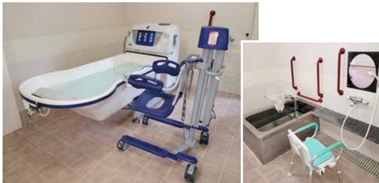
▲昇降式浴槽とリフトチェア

一人用浴槽も充実しており、入浴グリップ、入浴台、滑り止めマットなど用意しています。入浴にあたっては、ケアワーカーはもちろん看護師も介助し、お身体の状態を確認します。