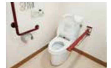
▲トイレは、車いすや手すりが必要な方に使いやすいバリアフリー設計。