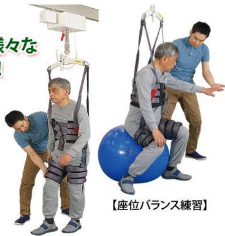
【座位バランス練習】