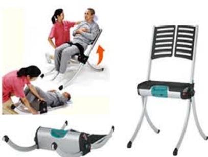
床からのかかえ上げを安全に ● ライザー