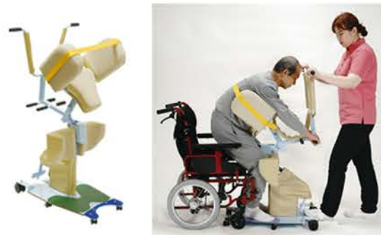
スリングシート不要の手動リフト ● ささえ手