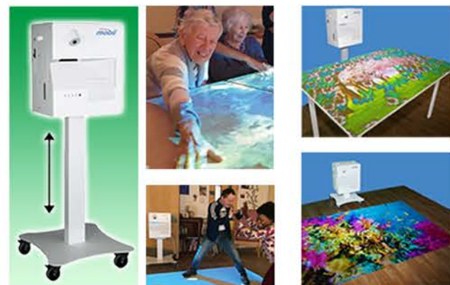
動きに反応・映像と音の刺激でレク・リハビリ ● オミ・ビスタ