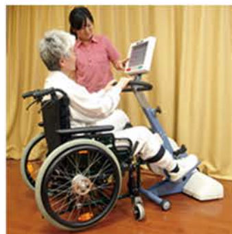
他動運動から抵抗運動まで 身体能力に対応 ● セラバイタル ティーゴ