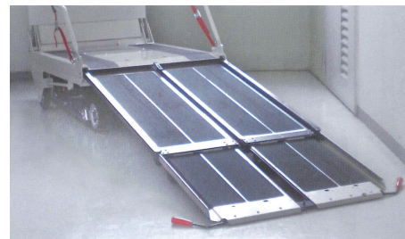
▲引き出し式スロープ