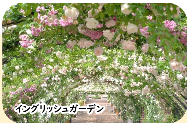
イングリッシュガーデン