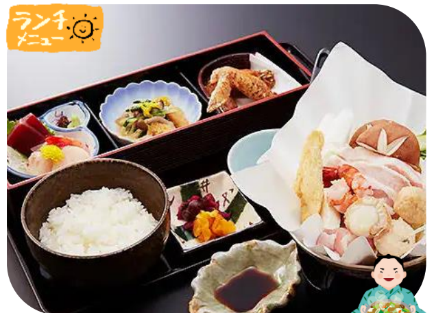
《ご昼食》ちゃんこ霧島: ちゃんこ鍋