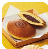
国技館やきとり カシクッキー 皇居外苑どらやき