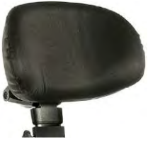
// QML030430 & QML030431