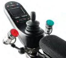
// QML110560 // QML110572 // QML110013 // QML110056 // QML110529 // QML110526