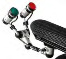
// QML110566 // QML110526 // QML110529