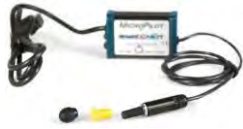
// QML110471 // QML110302