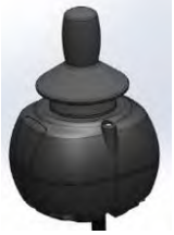
// QML110475 // QML110477 // QML110307 // QML110310