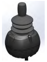
// QML110306 - QML110309 // QML110474 - QML110477