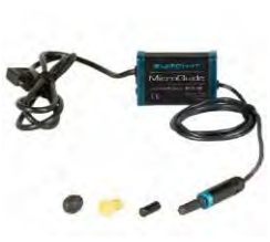
// QML110470 // QML110301 QML110304 // QML110305