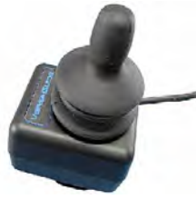
// QML110472 // QML110473 //