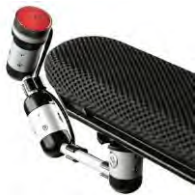
// QML110526 // QML110566