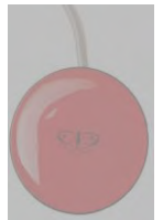
// QML110526 - QML110530