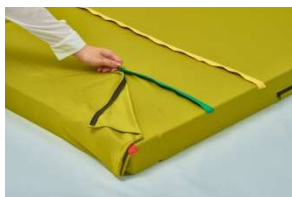
①レギュラー位置のファスナーを開けます