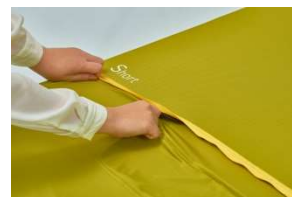
③ショート位置でファスナーを閉じます