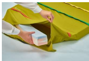
②中材を取り出します