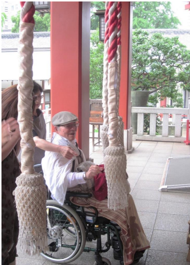
赤坂日枝神社にて