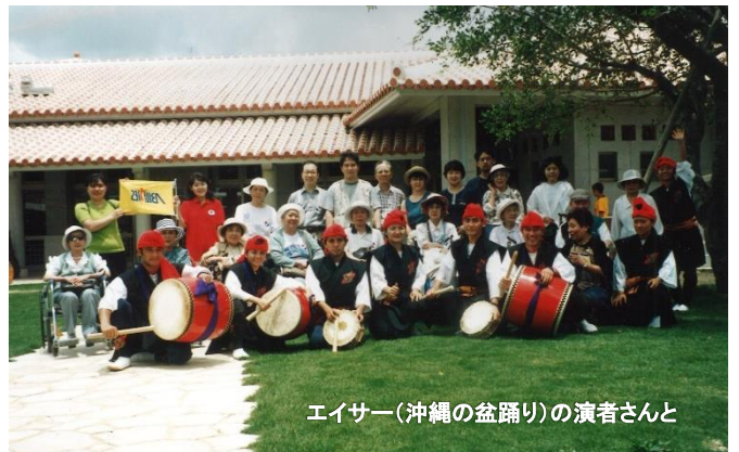
エイサー(沖縄の盆踊り)の演者さんと