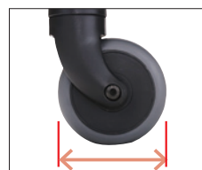
▲ユニシリーズのキャスター