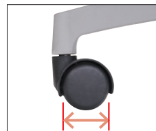
▲一般のデスクチェアのキャスター