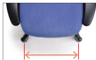
▲ユニシリーズのベース部