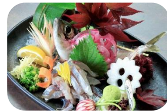
3日目昼食:関の小鰯膳