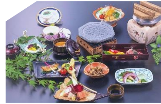
初日夕食:地元食材の懐石膳