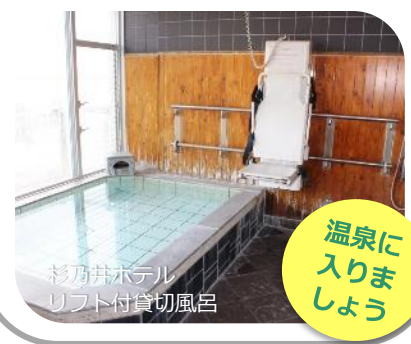
杉乃井ホテル リフト付貸切風呂

※ご希望の方にはスタッフが入浴のお手伝いをいたします。また、貸切家族風呂は時間制のため順番にてご案内させていただきます。