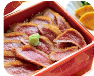
2日目昼食:あか牛の牛カツ重