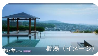
杉乃井ホテル (HBBE) 棚湯 (イメージ)

別府・観海寺温泉の高台に位置する温泉リゾート。お楽しみの温泉は、別府湾一望の展望露天風呂「棚湯」の他、リフト付の貸切風呂もご用意しました。源泉数・湧出量日本一の別府温泉を満喫しましょう。