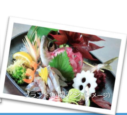
ブランド魚 関アジ(イメージ)