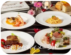
3日目夕食 (イメージ)