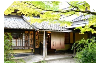
4日目昼食:亀の井別荘 湯の岳庵にて