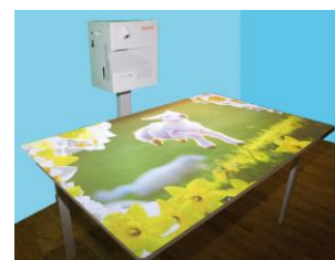
テーブルへの投影