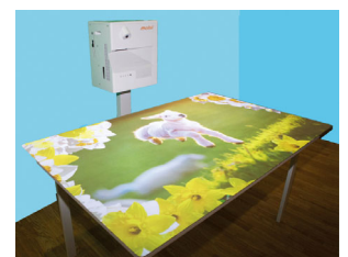
テーブルへの投影