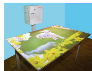
テーブルへの投影