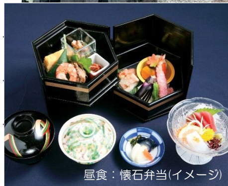
昼食：懐石弁当(イメージ)