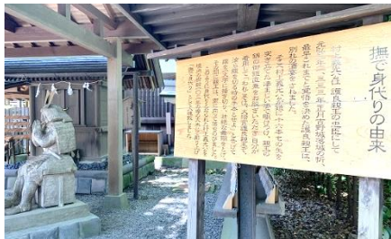
鎌倉宮の『厄割り石』と『撫で身代り』