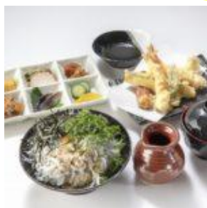
湯浅美味しいもん蔵「きてら」「釜揚げしらす丼御膳」(イメージ)