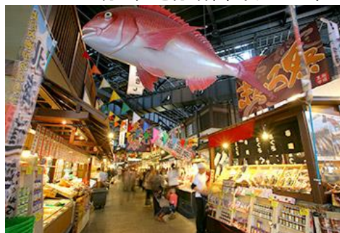
有田巨峰村 森園 (イメージ)