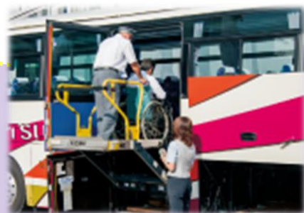
リフト付バス (イメージ)