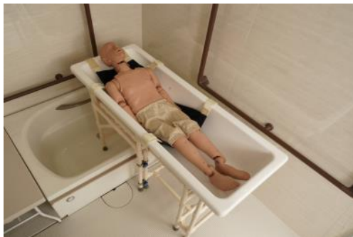
北九州市立総合療育センターとの共同開発品