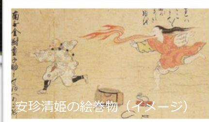
安珍清姫の絵巻物 (イメージ)