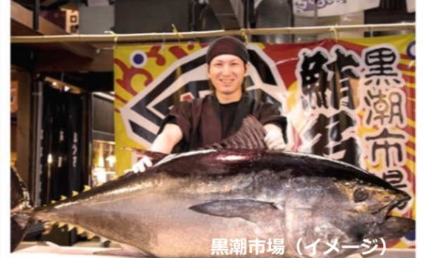
黒潮市場 (イメージ)