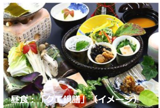
昼食：「ク工鍋膳」(イメージ)