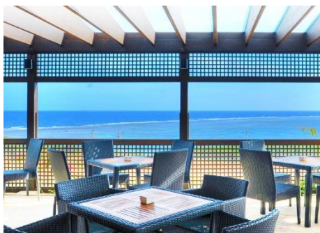
3日目：海見えるカフェ(イメージ)