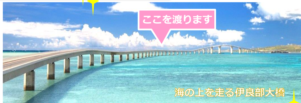
海の上を走る伊良部大橋