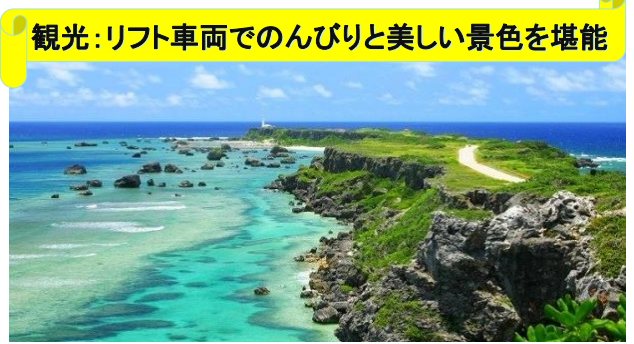
東平安名崎 (ひがしへんなぎさき) : 島の最東端からは360度水平線の絶景(イメージ)