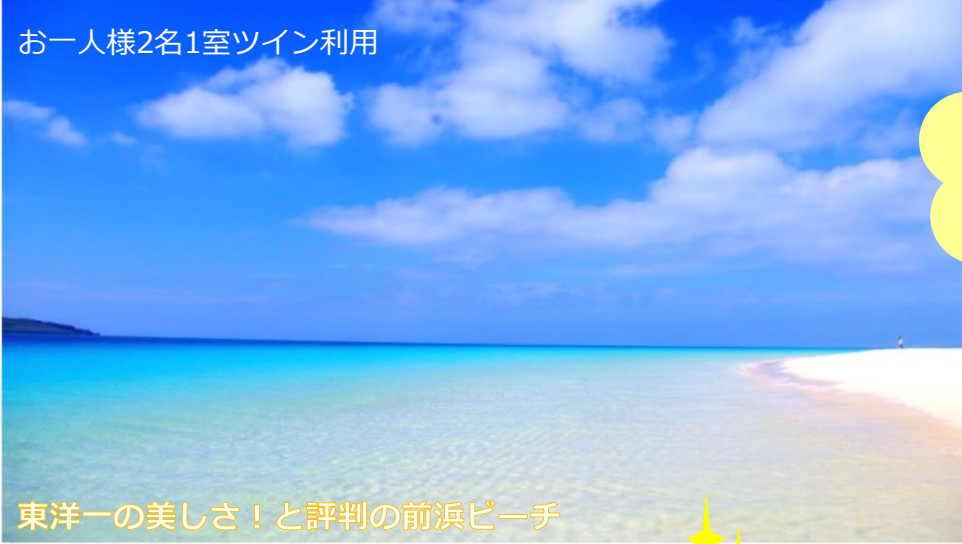
東洋一の美しさ！と評判の前浜ビーチ