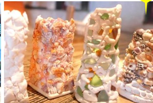
3日目：ランプシェード作り体験(イメージ)