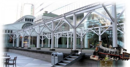
日本の鉄道発祥地である旧新橋停車場の駅舎を再現した建物にある銀座ライオンでの洋食ランチ