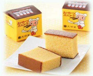
お土産カステラ(イメージ)