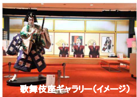
歌舞伎座ギャラリー(イメージ)