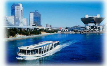
水上バス(イメージ)