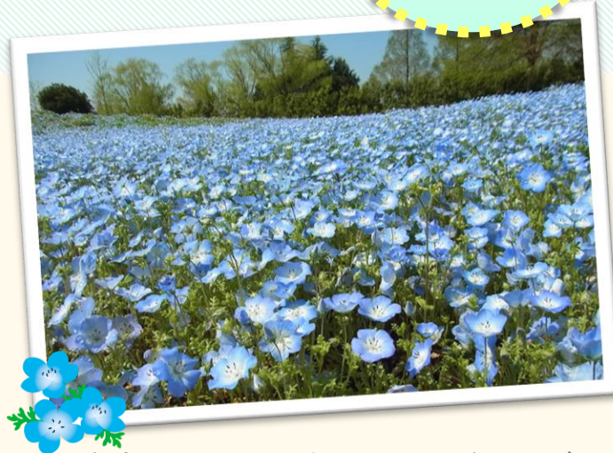
東武トレジャーガーデン:ネモフィラ(イメージ)

※写真について 掲載している写真は撮影時のアングル・天候など諸条件により、実際にご覧になる景観とは異なる場合があります。また、「イメージ」と付記されている写真は旅行日程とは関係ない旅行目的のイメージ、旅情等を表現したものです。