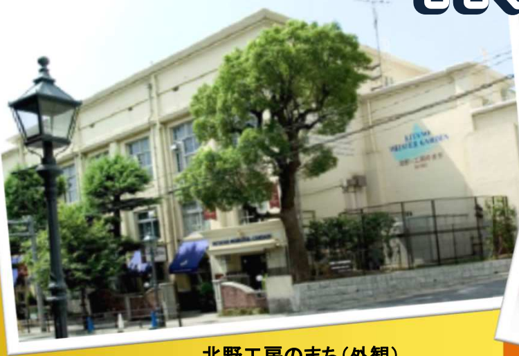
北野工房のまち(外観)