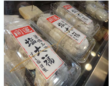
巣鴨土産の定番 塩大福

※スケジュールは道路状況等で変更となる場合があります、帰着地到着が遅れる場合があります。 ※万一帰着が遅れ、タクシー利用あるいは宿泊利用となる場合でも請求には応じられません。 ※帰路のタクシー予約等については時間に余裕を見て頂きますようお願いいたします。 ※天候や混雑などで滞在時間が短縮、中止、代替観光地に行程を変更する場合があります。