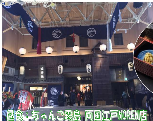
昼食：ちゃんこ霧島 両国江戸NOREN店