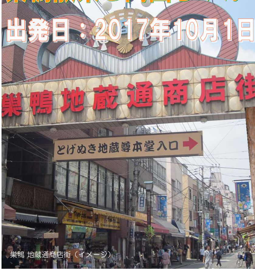
巣鴨 地蔵通商店街 (イメージ)

人気の両国と巣鴨の旅！ 深川 江戸資料館や ちゃんこ霧島での昼食 午後は、とげ抜き地蔵・ 地蔵通商店街の巣鴨散策