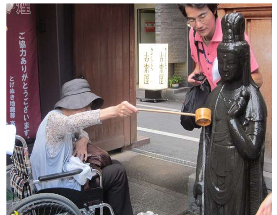
「洗い観音」に願いをこめて

特定非営利活動法人日本アビリティーズ協会 TEL：03-5388-7501/FAX：03-5388-7208 東京都渋谷区代々木4-30-3 新宿ミッドウエストビル2階