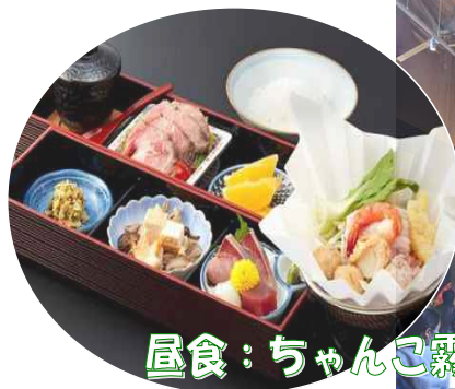
昼食：ちゃんご霧島 両国江戸NOREN店