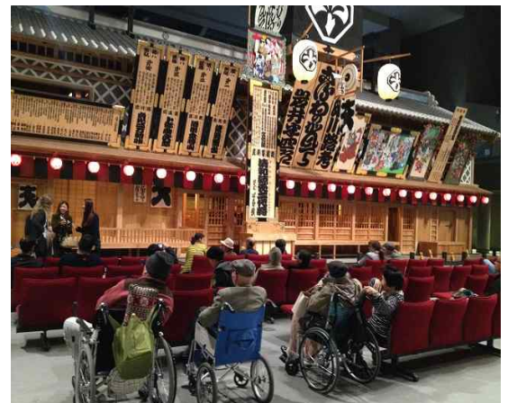
江戸東京博物館内(イメージ)

特定非営利活動法人日本アビリティーズ協会 TEL：03-5388-7501/FAX：03-5388-7208 東京都渋谷区代々木4-30-3 新宿ミッドウエストビル2階