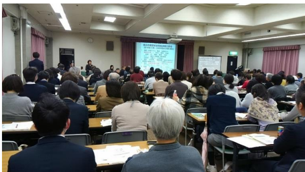
当日は200名近い参加者が集まりました