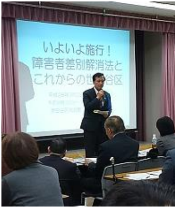
冒頭にあいさつをする 保坂展人世田谷区長