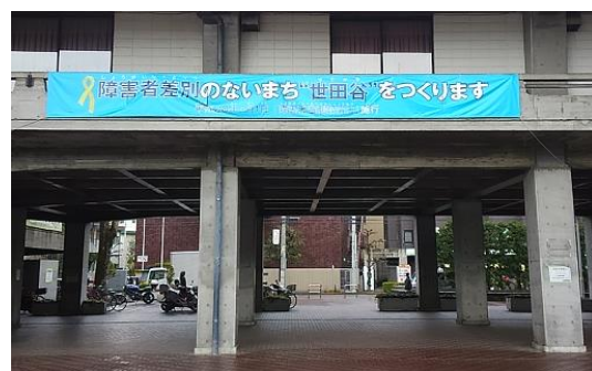
横断幕が掲げてある区役所入口