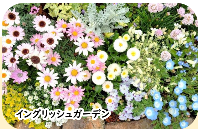
イングリッシュガーデン