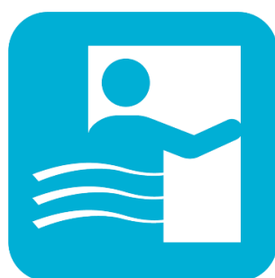
移動車内の 定期的な換気