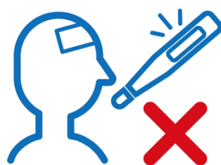
体調不良時の不参加 ※