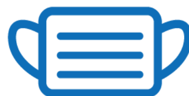
車内や混み合った場所 でのマスク着用

※ ツアー当日の朝に、発熱、咳、くしゃみ、全身痛、下痢などの症状がある場合は、決して無理をされず、ツアーの取消しをお願いいたします。