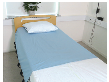
▲スピラプラス・ショート

ABILITIES アビリティーズ https://www.abilities.jp/