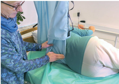
▲介護リフトを併用してスピラプラス・ショートで側臥位を維持