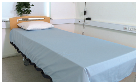
▲スピラプラス・ロング

●最大荷重 / 200kg (※ご利用者をマットレスから完全に持ち上げるものではありません) ●材質 / シーツ部: ポリエステル、コットン、 ハンドル部: ポリエステル