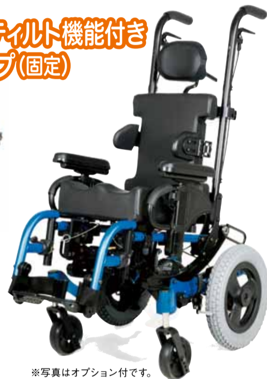
※写真はオプション付です。

ツールフィットプログラム: 購入から5年以内に一回、無料で成長対応のためのパーツ提供が受けられるプログラムです。成長対応拡張機能では足りない場合、このプログラムを利用いただけます。車いすの種類により条件と提供できるパーツが異なります。また、別途作業工賃がかかる場合がございます。詳しくはお問い合わせください。