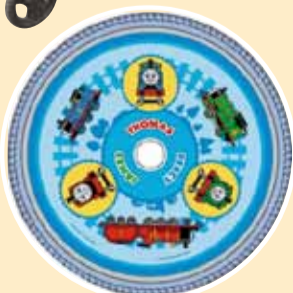
▲きかんしゃトーマスとなかまたち 16/18/24インチ