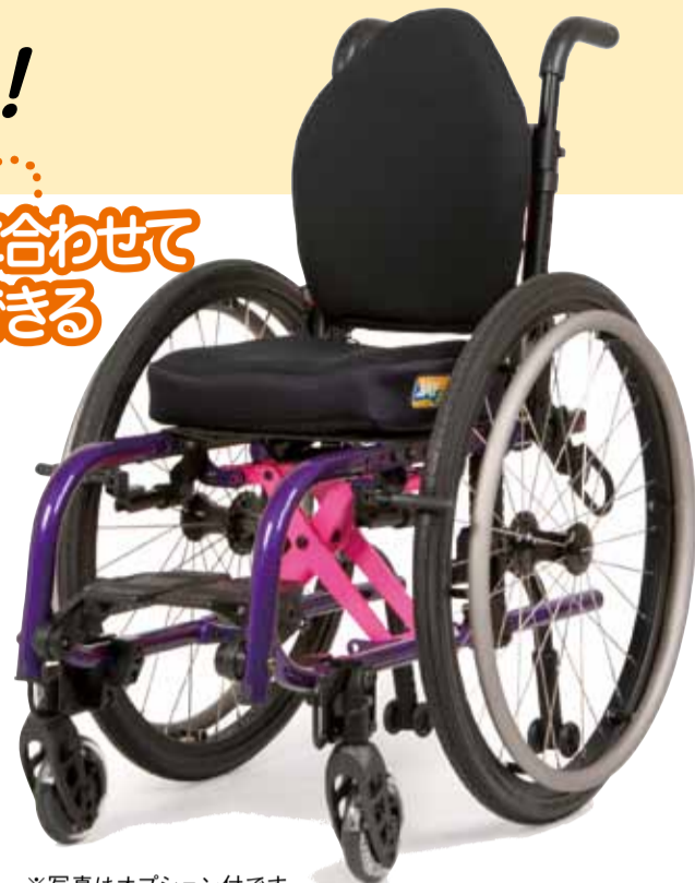
※写真はオプション付です。