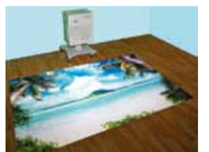
▲フロア投影で下肢運動