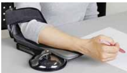
▲エルボーアンカー