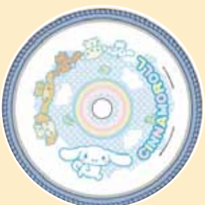
▲シナモロール 18/24インチ