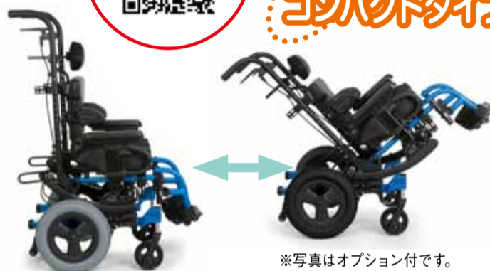
※写真はオプション付です。