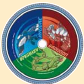
▲レックウザ・カイオーガ・グラードン 16/18/24インチ