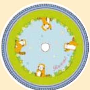
▲あらいぐまラスカル 16/18/20/22/24インチ