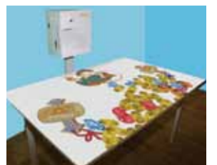
▲テーブル投影で上肢運動