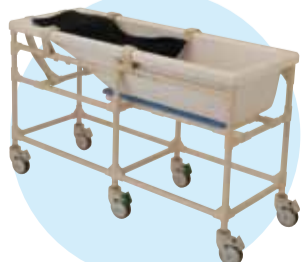
▲移動型フレームセット（キャスター有）