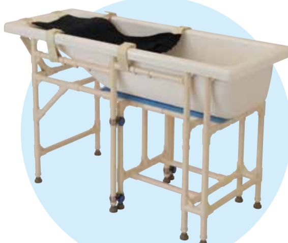
▲連結型フレームセット（キャスター無）