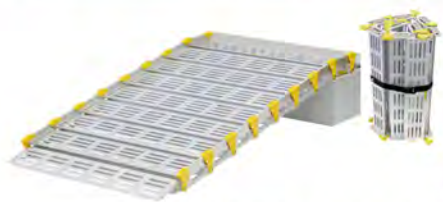
今まで対応できなかった環境に使える スロープ

たとえ、心身に障がいがあっても住み慣れた街に住み続けられる社会、生活環境を実現する事をめざし、最新のバリアフリー機器の展示や改修工事・設計に関する相談コーナーを開設して皆様の御来場をお待ちしております。