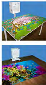
映像と音の刺激でレク・リハビリ 人の動きに反応する映像装置