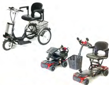
アクティブな生活を可能にする 電動カート