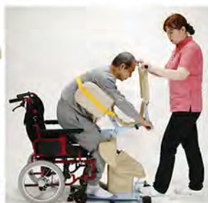
スリングシート不要 簡易型移乗リフト