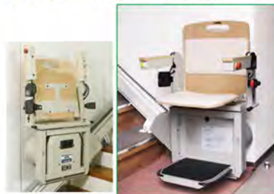
狭い階段でも使いやすいスリム設計。 国内最薄の階段昇降機。