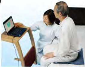
床ずれ予防クッション 体圧分布を視覚化、数値化