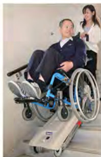
車いすに乗ったままで階段を昇降 階段昇降車