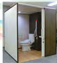
床配管の必要ない、工事の簡単なユニット型水洗トイレ