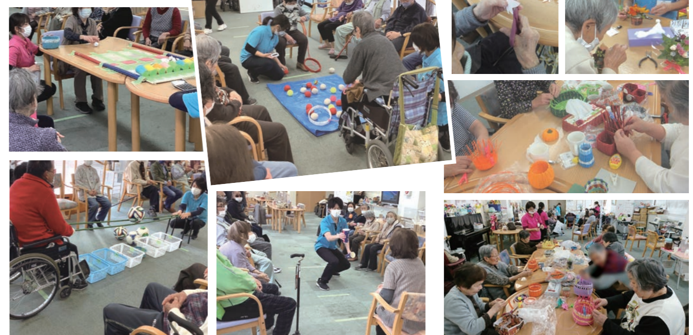
▼趣味活動(手工芸 作品づくり…等)