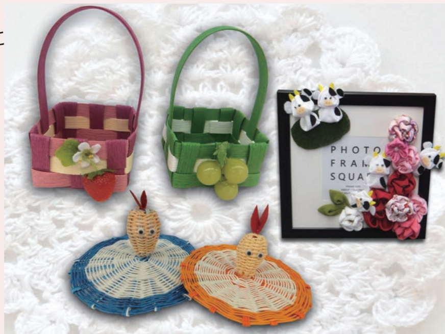
▶友人たちと一緒に作った作品です。

気心の知れた友人と一緒に 歌い、笑い、楽しみながら、 生きがいのある暮らしを 取り戻しましょう。