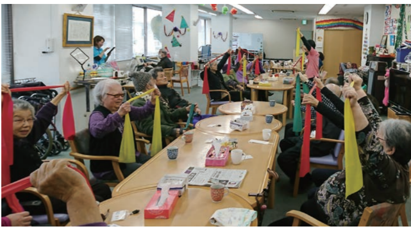
▲楽しみながら、筋力アップや関節可動域の拡張を。 椅子に座りながらのグループエクササイズで、様々な用具を使用して楽しみながら行なうことができます。