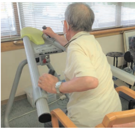
▲腕の前後運動で、肩の拘縮を予防。 椅子や車いすに座ったまま、上肢のスライド運動を左右交互に行ないます。上腕部から背中にかけての広域な筋力アップと肩関節拘縮予防に効果が見込めます。