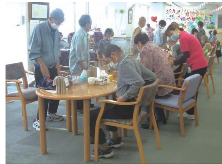
▲起立着席運動でふんばりの効く下半身へ。 起立着席運動は、歩行よりも転倒リスクが少なく、筋肉を効率よく鍛えることができます。ふんばりが効く下半身を作り、転倒予防を目指します。