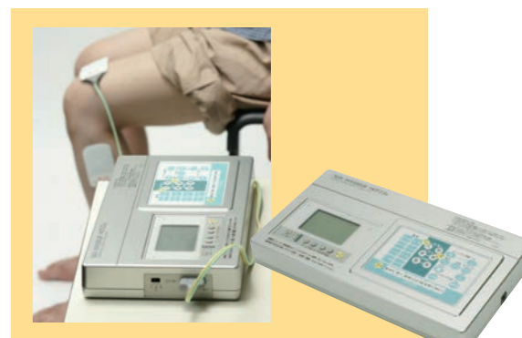
▲エクササイズ後のリフレッシュに、マッサージが順番でできます。 お帰りまでの一時、本格的な温熱低周波治療器で、腰、膝、肩、など気になる部位のマッサージができます。小型ながら接骨院にある機器と同等の機能があります。