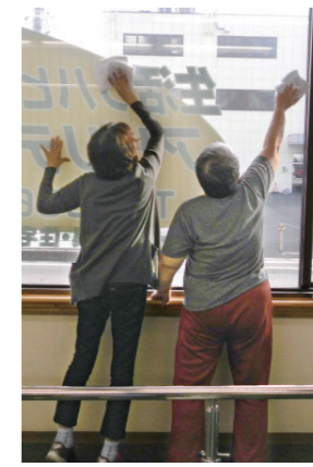
▲バランス力を高めて、転倒しにくい身体に。 様々な訓練機器を使って腕や上半身、指先のトレーニングを行ないます。日常生活における訓練（窓ふき、ペットボトル等の蓋を開ける等）も行ないます。