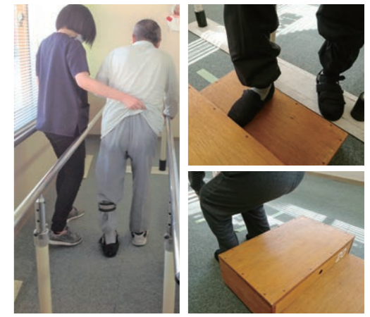
▲階段昇降や立ち座りの練習で、お出かけを安心に。 平行棒を使用しての歩行訓練、ご自宅の階段を容易に上がれるように高さの変更られる台を使用した練習、または異なる座面高さからの立ち上がり練習もできます。