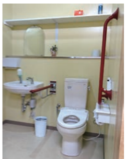
▲トイレは、車いすや手すりが必要な方に使いやすいバリアフリー設計。