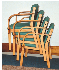
▲ 4脚まで積み重ねが可能。