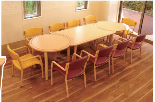
▼▲円形と長方形を組み合わせた例