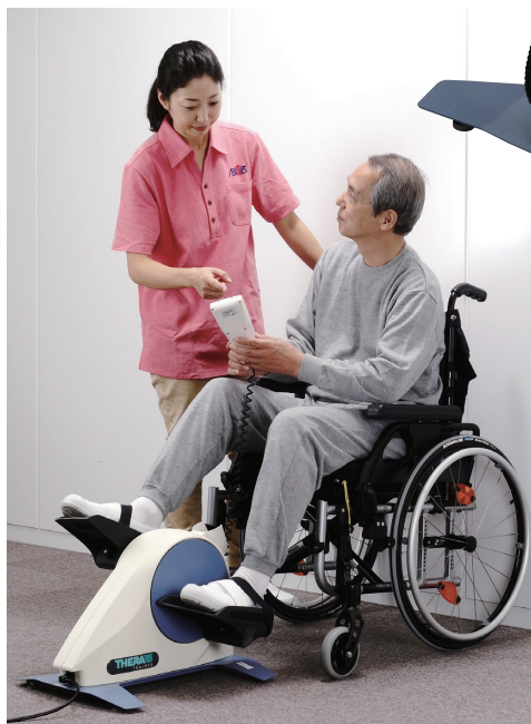
▲下肢のトレーニングに