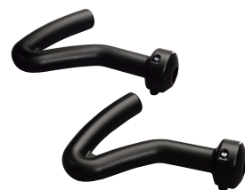
専用ハンドルとペダルが付属。