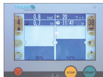
▲バイオフィードバック画面①