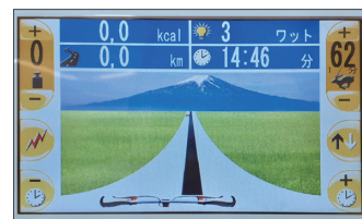
▲バイオフィードバック画面②