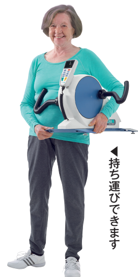
▲持ち運びできます