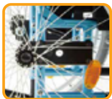
重心位置(C.O.G)調整可能