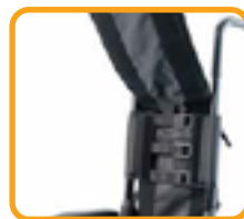
調節可能な ベルクロストラップ