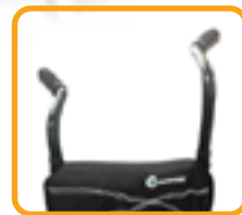
高さ調整式 プッシュハンドル

折りたたみが簡単で、高さ調節可能なプッシュハンドル、調節可能なアームレスト、パッド入りの調節可能な背もたれなど、考え抜かれたデザインは、ご両親に喜ばれることでしょう。