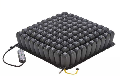
スマートチェック専用ロホクッション