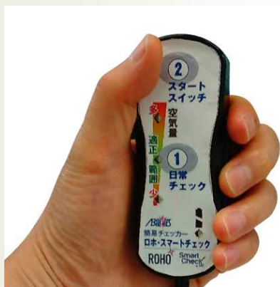
スマートチェック

「スマートチェック」と「専用ロホクッション」は、空気調整が難しいとされてきた「ロホクッション」の空気量を簡単に確認・調整することが可能となる商品です。